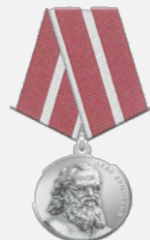
МЕДАЛЬЮ «ЗА СПАСЕНИЕ ПОГИБАВШИХ»