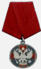
МЕДАЛЬЮ ОРДЕНА «ЗА ЗАСЛУГИ ПЕРЕД ОТЕЧЕСТВОМ» I СТЕПЕНИ